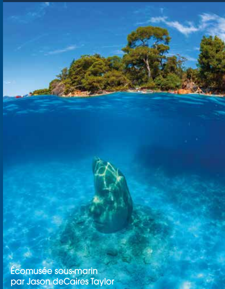
Écomusée sous-marin par Jason deCaires Taylor